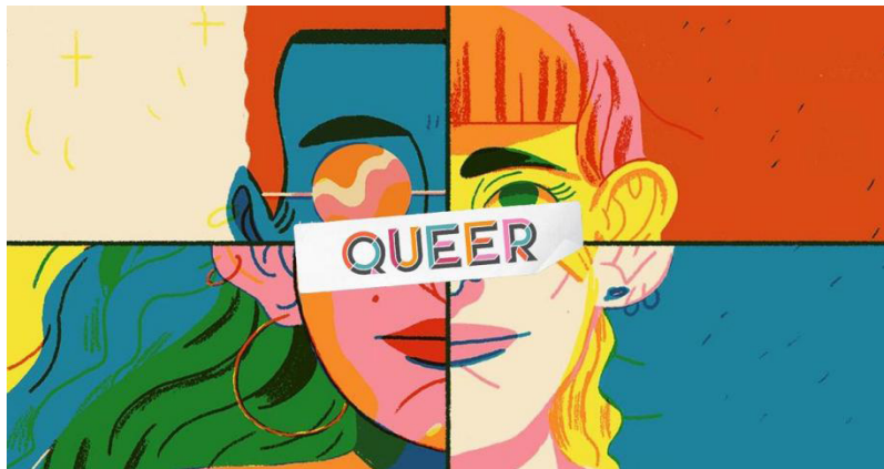
Figura 1 - Enjoy Maringá.